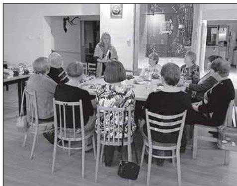
Podvečer s knížkou.

Ve spolupráci s místním hasičským sborem jsme 11. listopadu uspořádali slavnostní otevření,