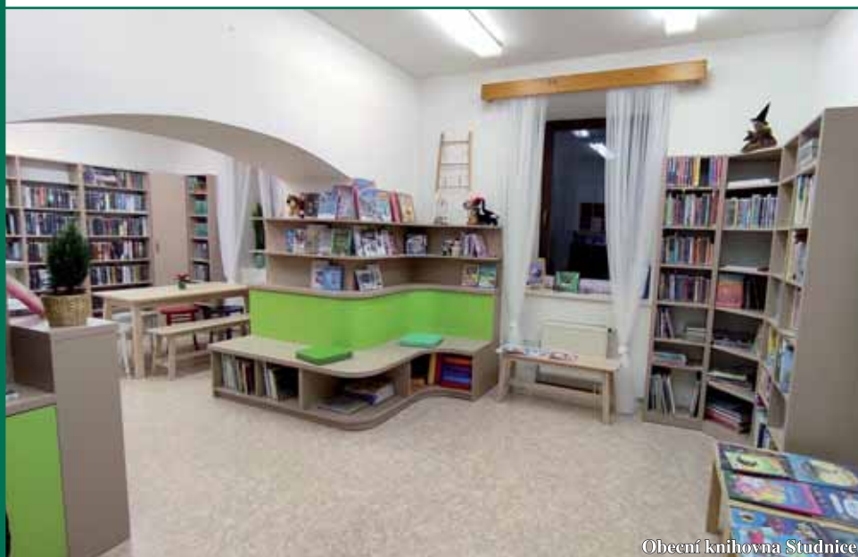
Obecní knihovna Studnice

Knihovnicko-informační zpravodaj Královéhradeckého kraje