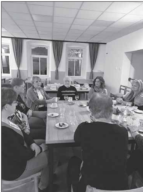
Podvečer s knížkou.

Kontakt na autorku: pujcovna.mkrk@kulturark.cz