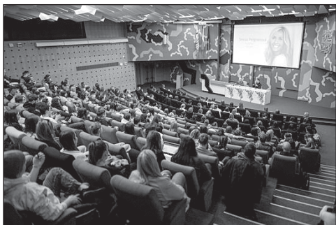
Pedagogické dny