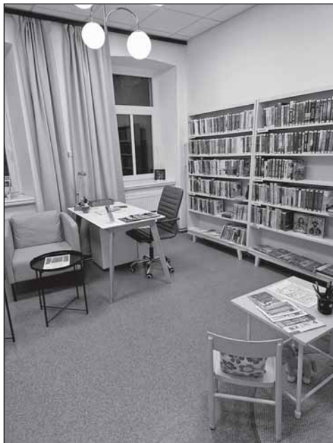
Interiér knihovny.

Koncem dubna 2023 se knihovna v Merklovicích uzavřela, aby se dočkala znovuotevření v novém kabátě. Budova bývalé mateřské školy, dnes spolkový dům, procházela rekonstrukcí. Výsledkem jsou nové, světlé prostory, zařízené v lehkém, moderním stylu. Knihovna se dočkala světlé, útulné místnosti, která není velká, ale pro potřeby půjčování knih a posezení stačí. Besedy s dalšími akcemi budou probíhat ve vedlejších prostorách.