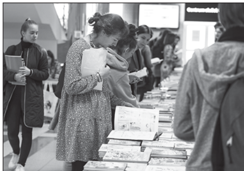
Atmosféra veletrhu na půdě UHK.

Hostování na letošním ročníku Týdne knihoven