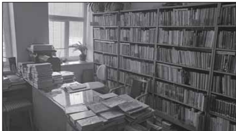
Kosičky před rekonstrukcí

Obecní knihovna Kosičky se dlouhá léta nachází v přízemí obecního domu spolu s obecním úřadem a poštou. Mimo výměnu oken a výmalbu knihovna dosud nikdy neprošla většími úpravami či modernizací prostor. V lednu 2023 podala obec Kosičky žádost o finanční příspěvek v dotačním Programu obnovy venkova Královéhradeckého kraje do nově zřízeného titulu Modernizace prostorového vybavení knihoven. Cílem projektu byla