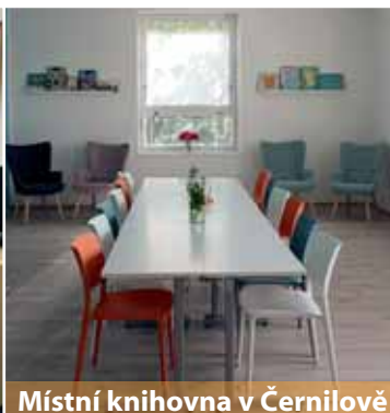
Místní knihovna v Černilově