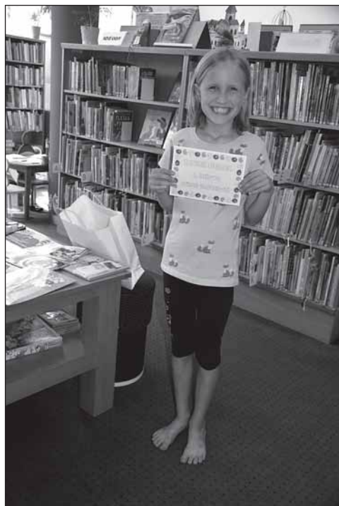
Vítězka Lovců perel