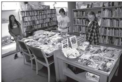
Jarmark Lovců perel

Nutno říci, že v letošním roce naši malí čtenáři trhali rekordy. Zatímco v minulých letech přečetli za 8 měsíců zhruba 260 knížek, letos 22 přihlášených dětí přečetlo neskutečných 411 knih!