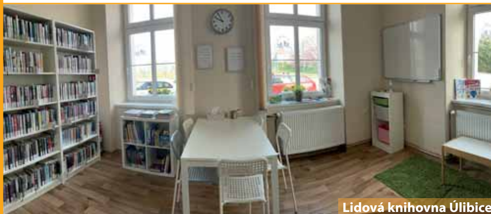
Lidová knihovna Úlibice

Knihovnicko-informační zpravodaj Královéhradeckého kraje