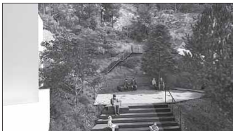
Vizualizace Atelier Partero