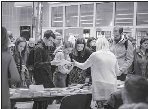
Atmosféra veletrhu na UHK.

Pro zájemce, kteří potřebují dobře pracovat s česky psanou odbornou literaturou, beletrií i odbornými články, bude jistě přínosný od 11.30 workshop Jak vyhledávat v Národní digitální