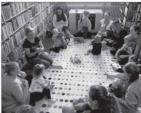
Bookstart v Černilově

Černilovská knihovna je komunitní knihovnou s širokým zaměřením a nabídkou služeb pro všechny věkové kategorie uživatelů z řad čtenářů a místních obyvatel. Dlouhodobě aktivně spolupracuje se ZŠ, MŠ, spolky a dalšími organizacemi nejen v Černilově. Rozmanitost místních čtenářských zájmů vedla k tomu, že vybudovaný knižní fond a nabídka aktivit a služeb je pestrá a aktuální. Knihovna je bohatě zapojená do celostátních aktivit a kampaní. Namátkově jmenujme Čtenář roku, Bookstart – S knížkou do života, Už jsem čtenář – Knížka pro prvňáčka, Týden knihoven či Lovci perel. Nesmíme zapomenout ani na charitativní aktivity typu Krabice od bot, Český den proti rakovině, Den válečných veteránů, semínkovna, swapy a jiné. Pořádá velikonoční jarmark a adventní trh, výstavy, různá tematická výtvarná vyrábění, hudebně-divadelně-literární festival Černilovský dvůr či promítání filmů z festivalu Jeden svět v rámci projektu Promítej i ty. Zároveň se věnuje udržitelnosti, prohlubování znalostí místní historie a regionálních osobností, mediálnímu vzdělávání