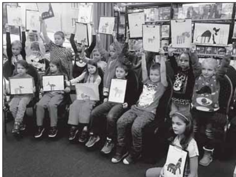
Beseda pro ZŠ k výstavě Karel Poláček

Knihovna se těší zájmu čtenářů, dětí i dospělých, kteří prostory knihovny využívají i jako komunitní centrum. Díky dětskému koutku zde nacházejí prostor ke scházení zejména maminky s dětmi na mateřské dovolené. Proto byl také z jejich strany poměrně velký zájem o nový projekt Bookstart, do kterého se knihovna od letošního roku zapojila. Mezi další velmi oblíbené akce pro děti patří každopádně Noc s Andersenem a Halloweenská nocování, které knihovna pravidelně organizuje.