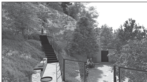
Vizualizace Atelier Partero