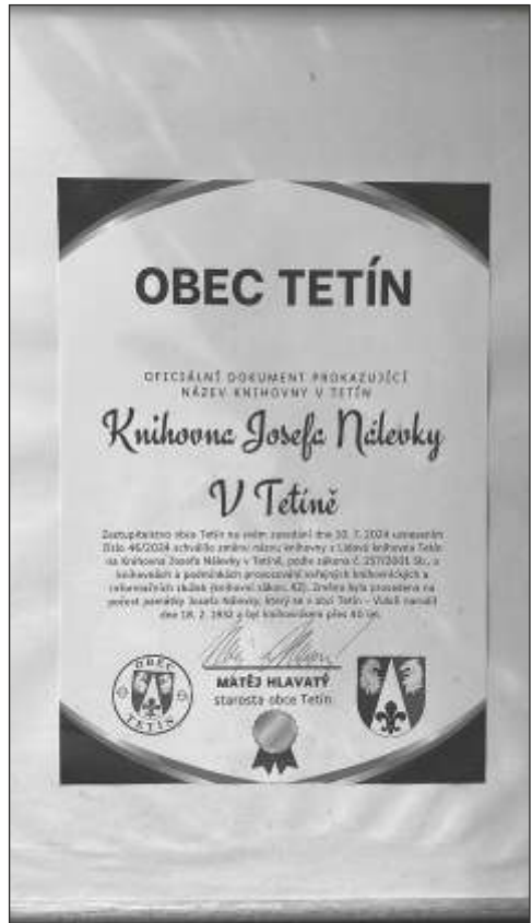
Dokument o přejmenování knihovny