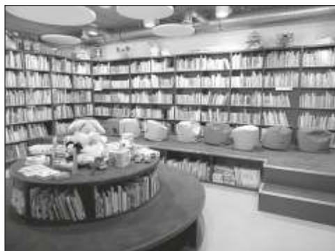
Knihovna v Chlumci nad Cidlinou.

Kontakt na autorku: hubertova@knihovnahk.cz