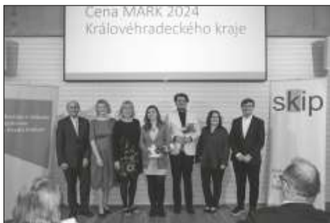
Cena MARK Královéhradeckého kraje