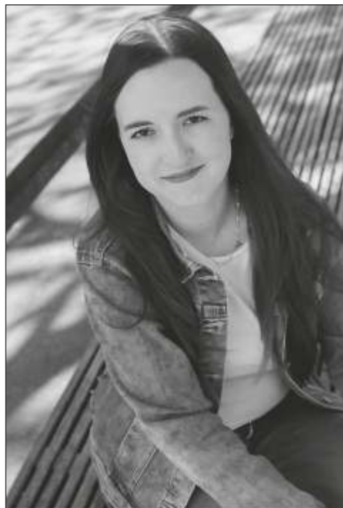
Iveta Šedová.

Kolegyně Iveta Šedová pracuje v MěK Ústí nad Orlicí od roku 2015. V knihovně pracovala jako dobrovolnice již v době VŠ studií. Zaměřuje