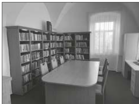
Obecní knihovna Šonov je vybavena pro setkávání čtenářů.

Šonov je malá obec, čítající do 300 obyvatel; škola tu není, máme pouze mateřskou školku, do které se letos přihlásilo 10 dětí. Dětských čtenářů z řad školáků chodí poskrovnu, ale nabízí se spolupráce s novou paní učitelkou z mateřské školky. Protože školkové děti jsou nečtenáři a jejich pozornost je krátká, budou to hravé programy, za hezkého počasí různé stezky s hrami a plánujeme adventní tvoření a další akce podle ročních období (vynášení Moreny, Velikonoce