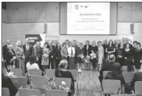
Knihovnice roku Královéhradeckého kraje 2024