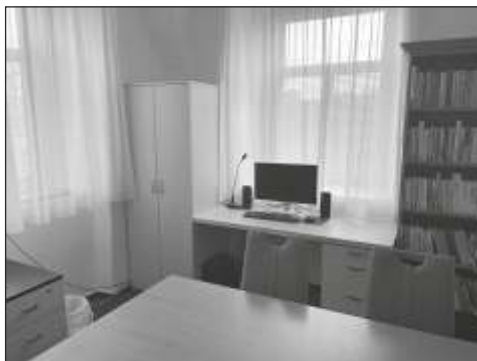
Nový nábytek v šonovské knihovně.

atd.). Nejbližší plánovaná akce je putování se skřítkem Šonováčkem ke kapličce, kdy děti z MŠ budou po cestě plnit úkoly a na konci je bude čekat překvapení: záložka do knihy a sladkosti. Pro dospělou veřejnost plánujeme nedělní tvoření, které se už v minulosti osvědčilo. Pravidelně naši knihovnu navštěvují ženy, mužského čtenáře zatím nemáme, proto se i tvoření točilo kolem ručních prací. Byly to celkem navštěvované akce a při té příležitosti si čtenářky nabraly novou várku čtiva. V případě zájmu by tu mohl vzniknout i ženský klub, jak je tomu v jiných obcích. Prostory knihovny jsou nyní k tomu vhodně vybavené.