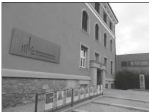
Knihovna v Šumperku.